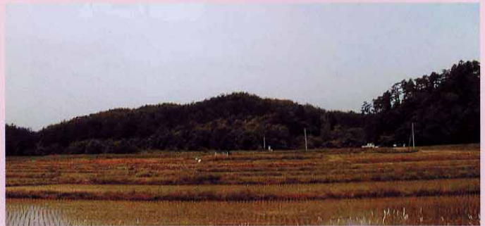
下小松古墳群が連なる眺山