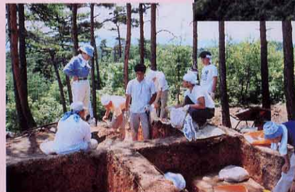
発掘調査のようす