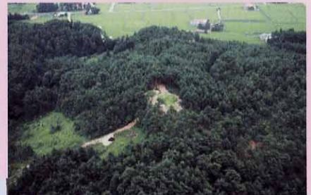
前方後円墳 (小森山支群)